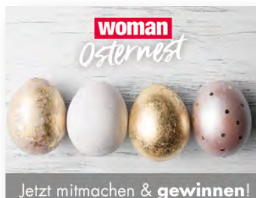
Mobile Content Ad (Symbolbild)